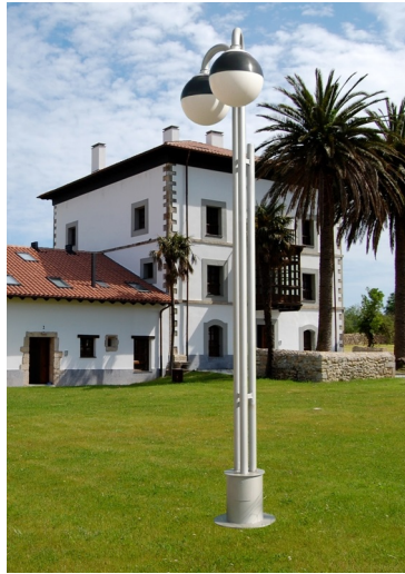
Modelo 2012 (2 Brazos)