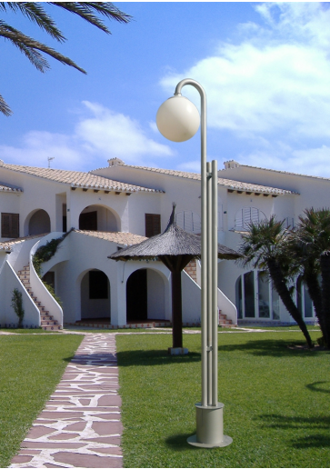
Modelo 2011 (1 Brazo)