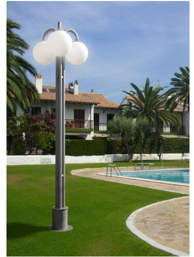
Modelo 2013 (3 Brazos)